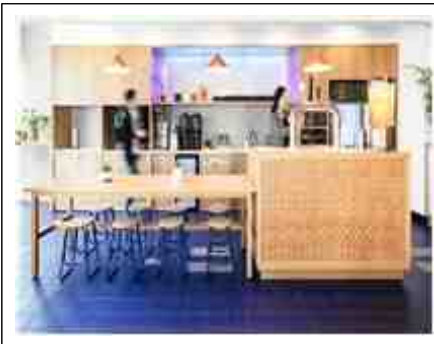
위워크 풀 서비스 팬트리