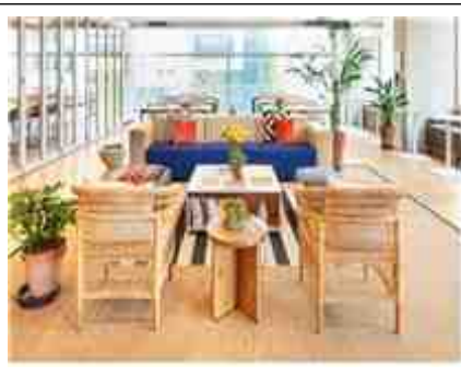
커뮤니티 라운지 및 업무공간