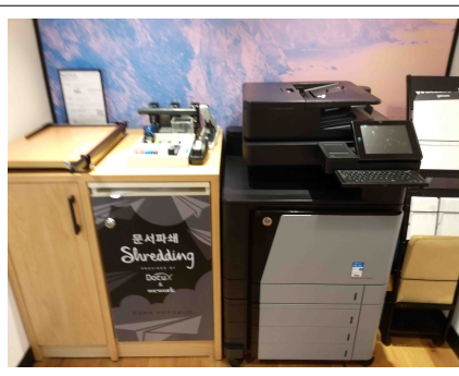
공용 프린트 스테이션